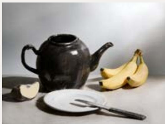
六级素描静物照片写生（参考图片）