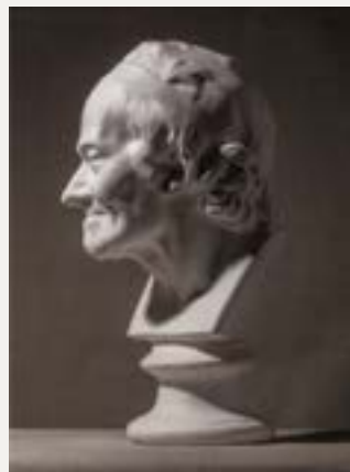
八级石膏像照片写生（参考图片）