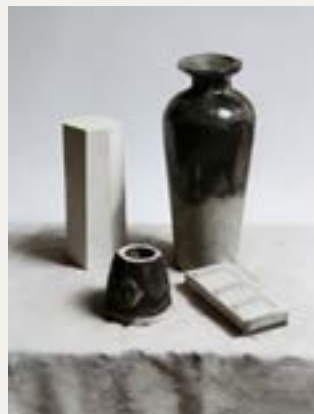
五级素描静物与石膏组合照片写生（参考图片）