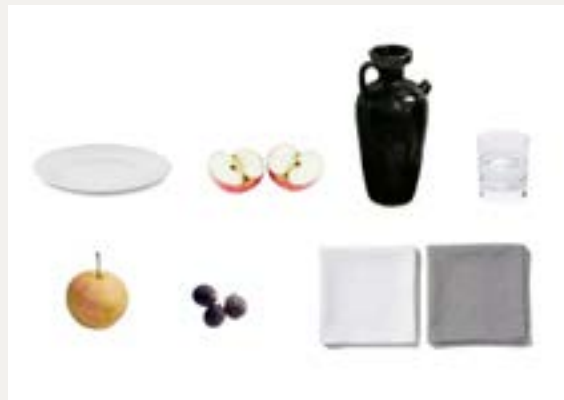
七级素描复杂静物照片写生（参考图片）