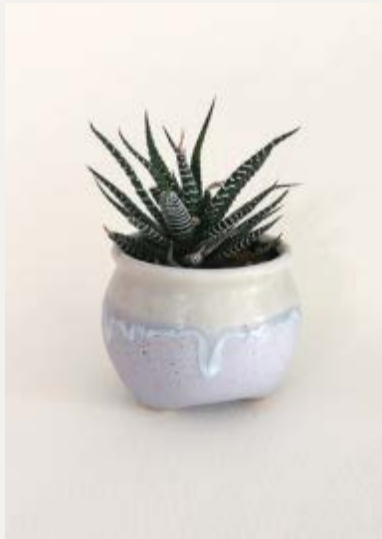
一级植物照片写生（参考图片）