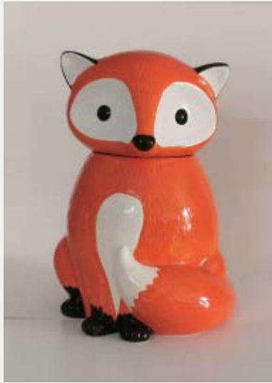
二级玩具、文物照片写生（参考图片）