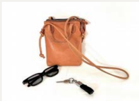
三级静物组合照片写生（参考图片）