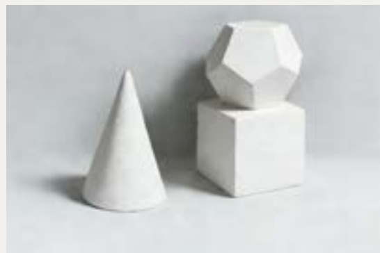
四级素描石膏几何体照片写生（参考图片）